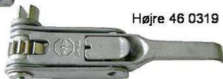
Højre 46 0319

Kraftige PWP presenningstrammere med skralde. Galvaniserede . Venstre og Højre. Aksel med firkant 12 x 12 mm. eller slids Ø25 mm. Lgd. 250 x hjd. 85 x dbd. 40 mm. Vægt 1,2 kg.