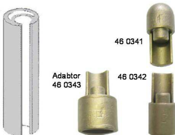
Adaptor 46 0343

46 0316 Presenningstrammer m/skralde og firkant Venstre. 46 0317 Presenningstrammer m/skralde og firkant Højre. 46 0318 Presenningstrammer m/skralde og slids Venstre. 46 0319 Presenningstrammer m/skralde og slids Højre.