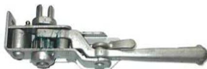
Højre 46 0313

46 0311 Nøgle til 46 0308/0309/0310 Vægt. 0,7 kg.