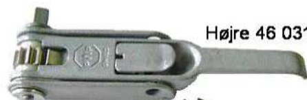
Højre 46 0317

46 0314 Presenningstrammer m/skralde. Venstre. 46 0315 Presenningstrammer m/skralde. Højre.