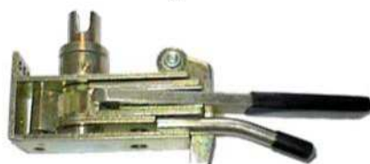
Højre 46 0315

46 0312 Presenningstrammer m/skralde. Venstre. 46 0313 Presenningstrammer m/skralde. Højre.